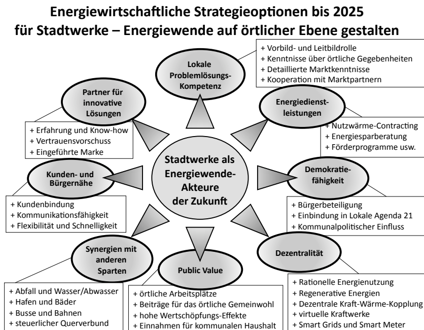
Abbildung 2: Neugegründete Stadtwerke bieten zahlreiche Vorteile und Strategieoptionen im Rahmen der örtlichen Energiewende